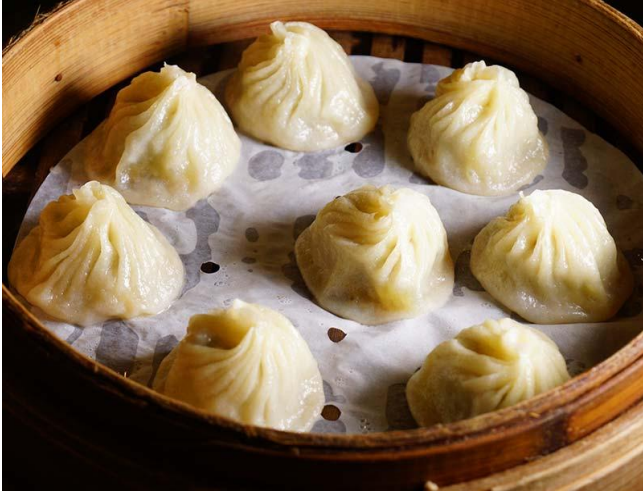
小籠包/xiaolongbao / ショウロンポウ / 샤오롱바오(찜만두)