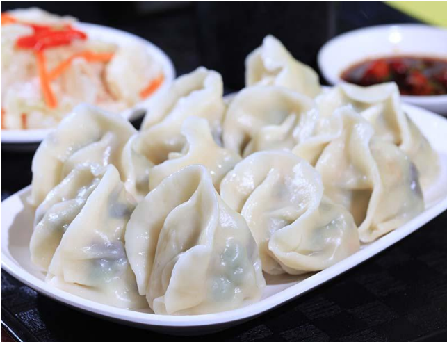
水餃/dumplings / 水ギョーザ餃子 / 웨이자오(물만두)