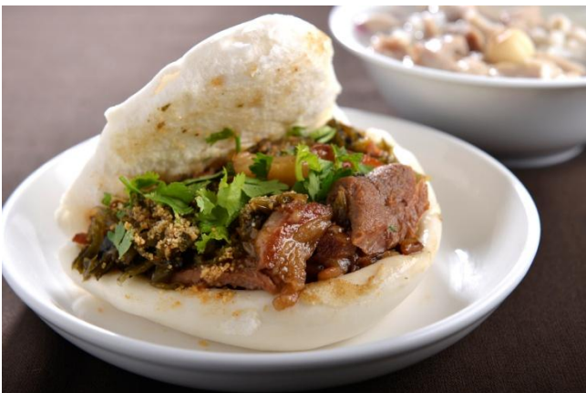
割包/刈包/guabao / 台湾ハンバーガー / 과바오(타이완식 햄버거)