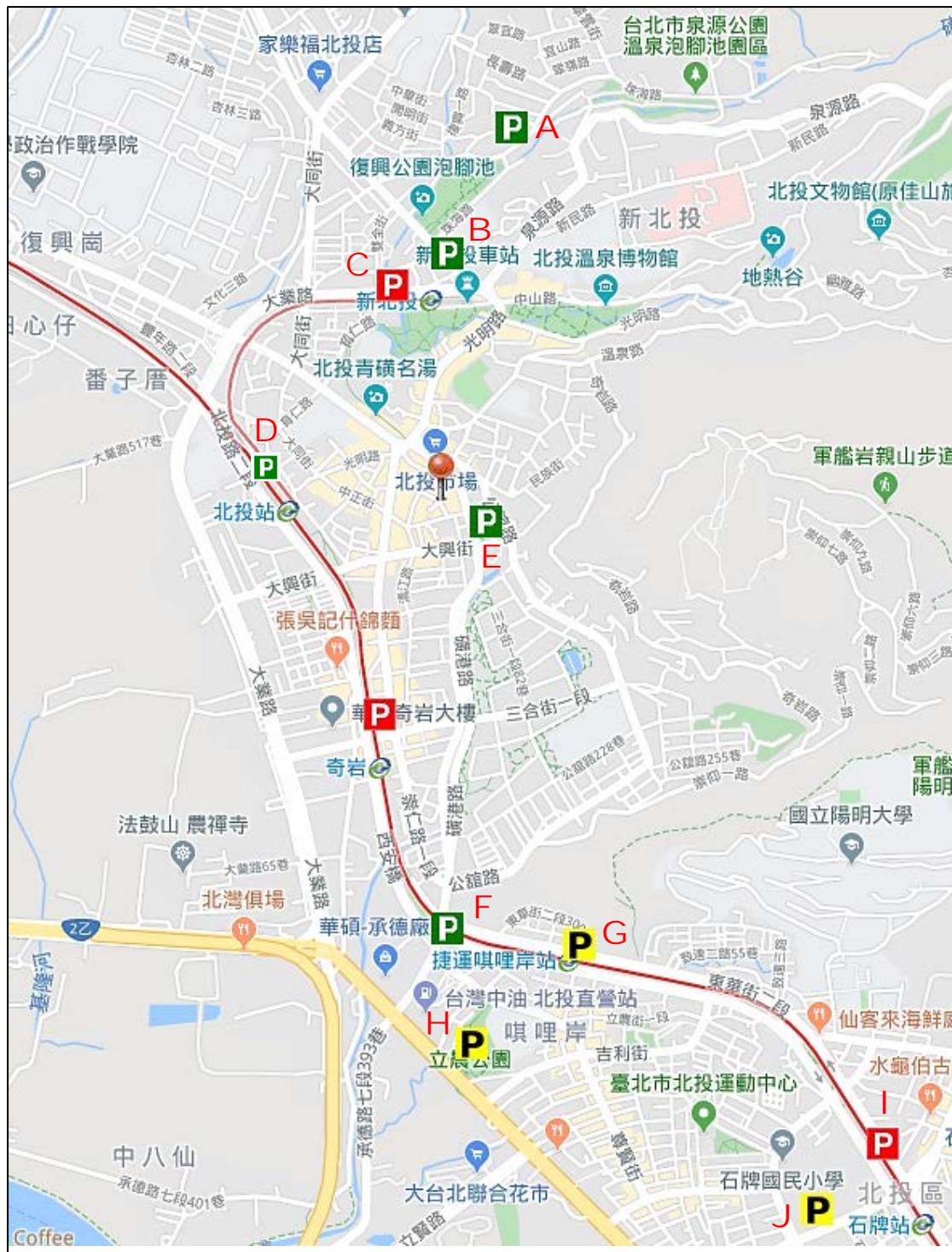
圖2 北投區停車資訊圖