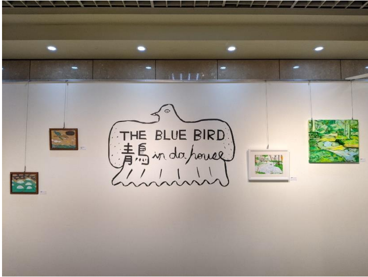
圖1：臺北市青少年發展暨家庭教育中心藝文邀請展「青鳥 in da house」即日起至113年5月26日在青發家教中心1樓展覽區展出。