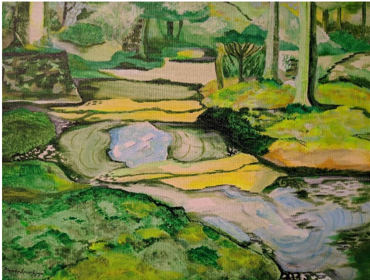
圖2：創作者卡沃作品〈西芳寺二〉，記錄他遊走於京都西芳寺內感受到的沉靜及對生命的敬畏。