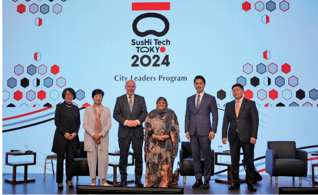
蔣萬安市長出席2024 SusHiTech論壇開幕式

台北市長蔣萬安日前至東京進行參訪，除了出席「2024 SusHiTech市長論壇」開幕式，分享台北智慧防災經驗，也與日本前首相麻生太郎、東京都知事小池百合子、大阪府知事吉村洋文等人會面，交流城市經營、治理等經驗。