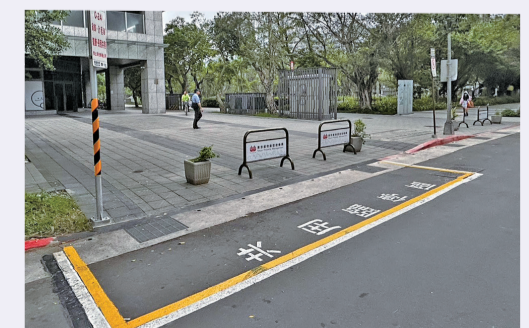
台北市首創「共用臨停區」／台北市交通局

此外，除了一般計時收費停車格，台北市路邊還有限時停車格、貨車裝卸停車格、身障停車格、婦幼停車格、汽機車彈性共用格、計程車招呼站等不同種類或用途的停車格。為了方便民眾辨識，除了顏色區隔，停車格內或路邊也會標識文字或立牌。例如「共用臨停區」停車格在原有的白線內會再漆上黃色標線，並標示「共用臨停區」字樣。提醒民眾停車前，務必看清停車格標誌及標線，以免受罰。