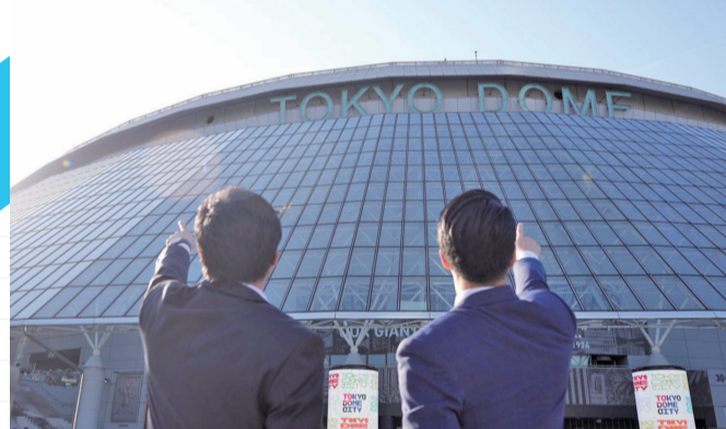
蔣萬安市長參訪東京大巨蛋／台北市秘書處