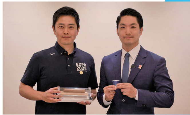
蔣萬安市長與大阪府知事吉村洋文合影