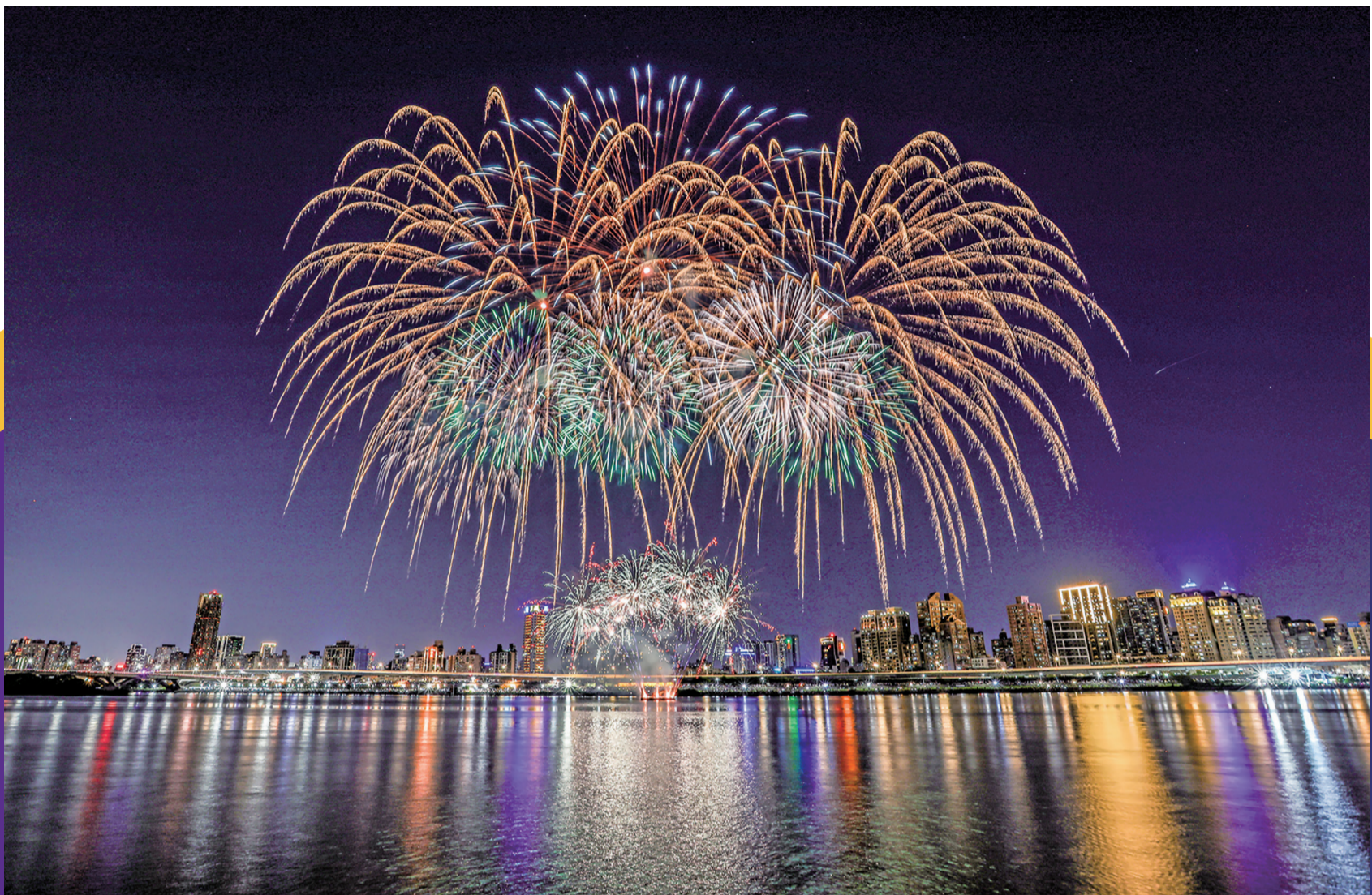
2024大稻埕夏日節將舉辦4場煙火秀/台北市觀光傳播局