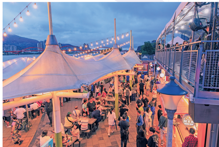
關渡貨櫃市集匯集美食與水岸風光／台北市工務局水利工程處

台北市政府自2021年起陸續整修關渡碼頭周邊設施，包括重現碼頭棧道歐式風情、擴建觀景平台區、擴大及優化噴泉區域、增設打卡點、裝置藝術、戲砂區與體健設施等，未來也規畫與航運業者合作，讓民眾可搭乘往返關渡與大稻埕的定時航班，從迪化商圈一路玩到北投泡溫泉、參拜百年媽祖廟關渡宮等，輕鬆打造兼具文化與自然風光的一日小旅行。