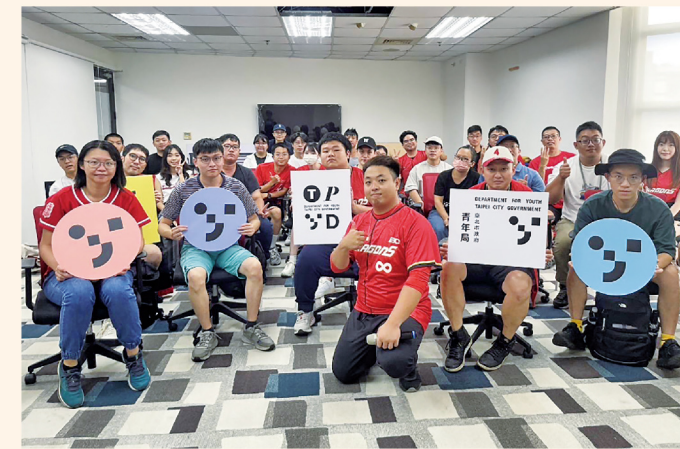
學員與味全龍應援團成員合影