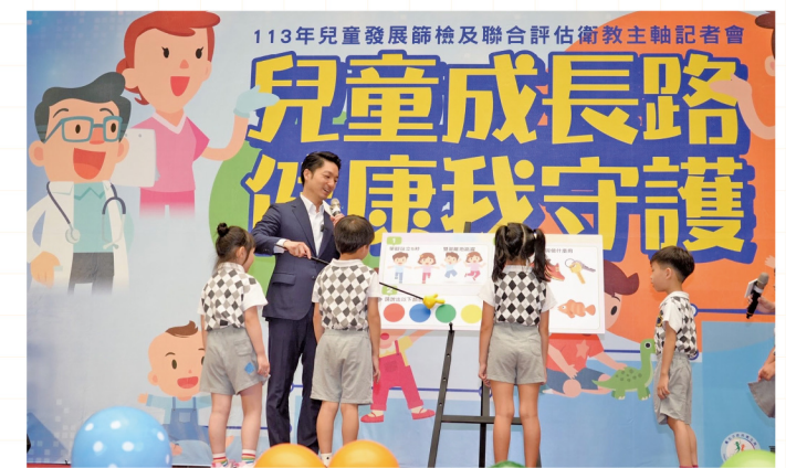
「0至6歲兒童健康照護網絡」陪伴孩子健康成長

年滿40歲的市民，除了3年一次免費成人健檢，即日起至10月31日，北市府加碼推出40至64歲設籍台北市市民，只要在市立聯合醫院接受成人健檢，額外提供尿酸等6項免費檢查，補助名額有限，用罄為止。