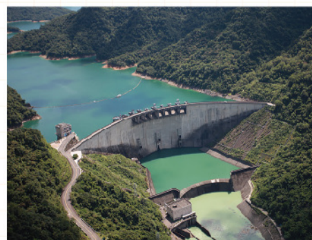
翡翠水庫邊坡預防健檢減緩淤積

該計畫後續也將整理翡翠水庫蓄水淹沒區的人文遺跡、集水區相關動植物生態分布等資料，一併納入翡翠水庫邊坡管理系統，做為未來施政計畫之參考。