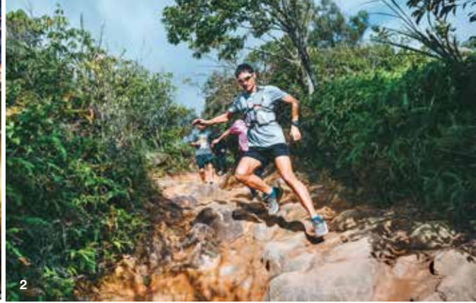
1. 今年獲金標籤認證的台北馬拉松，是台灣具代表性的國際路跑賽事。 2. 越野跑須因應地形變化快速調整步伐。

由在台外國人成立的「台北捷兔」是最早在台灣推廣越野跑的團體，「但一個團體還不足以稱為文化，需要許多人的共同參與，且彼此交流、訂定規則，才足以形成一種文化。」江晏慶觀察，約自2014年開始，台北的越野跑賽事增多，讓更多人認識這項運動的魅力，2019年政府推動開放山林政策，更進一步促使大眾重新看待這項運動，有助於推進台北越野跑文化的發展。