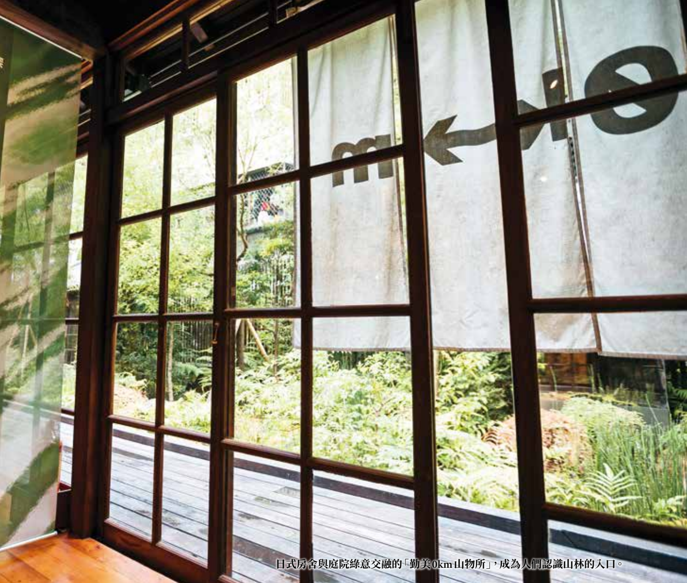
日式房舍與庭院綠意交融的「勤美0km山物所」，成為人們認識山林的入口。