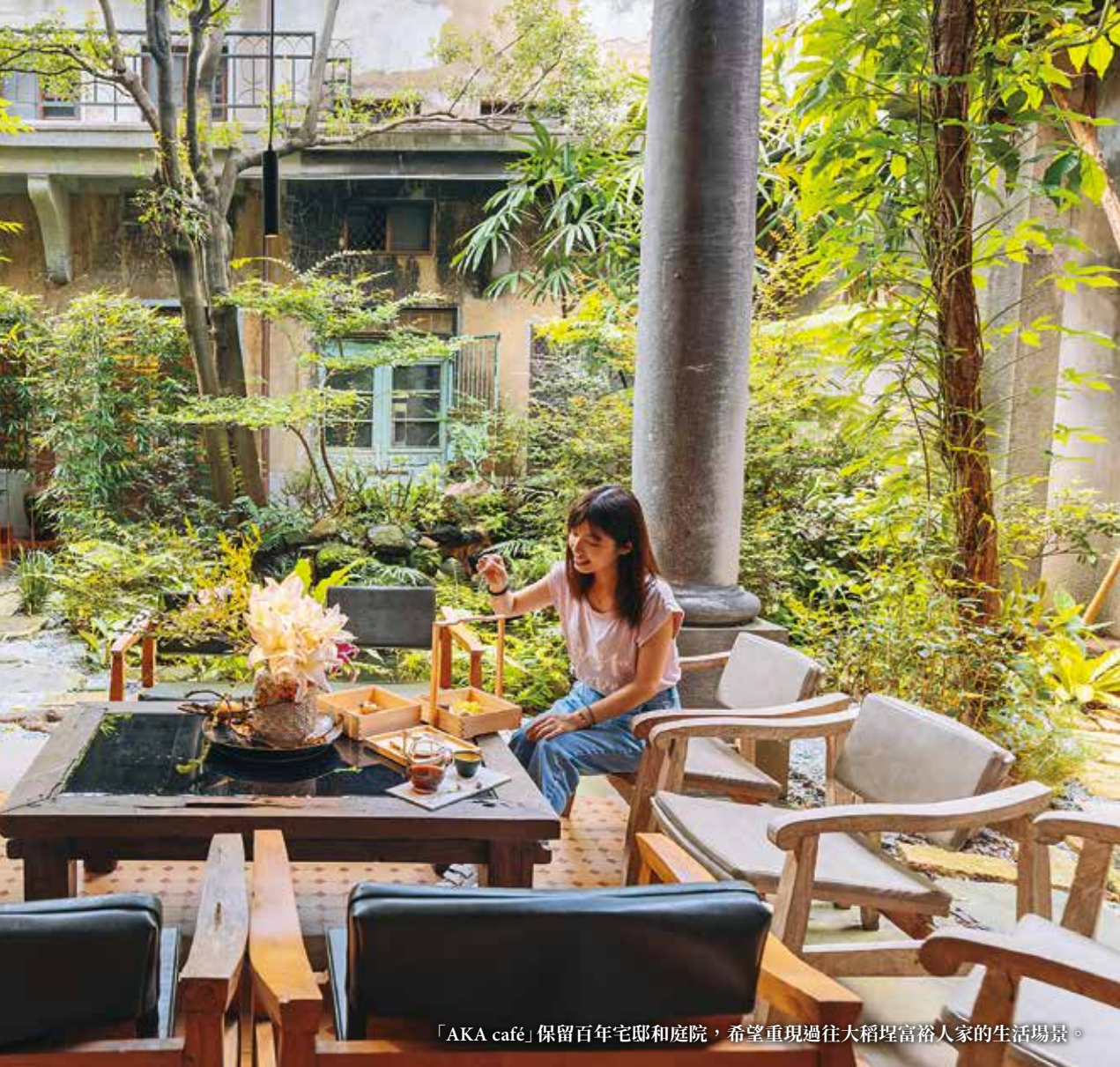
「AKA café」保留百年宅邸和庭院，希望重現過往大稻埕富裕人家的生活場景。