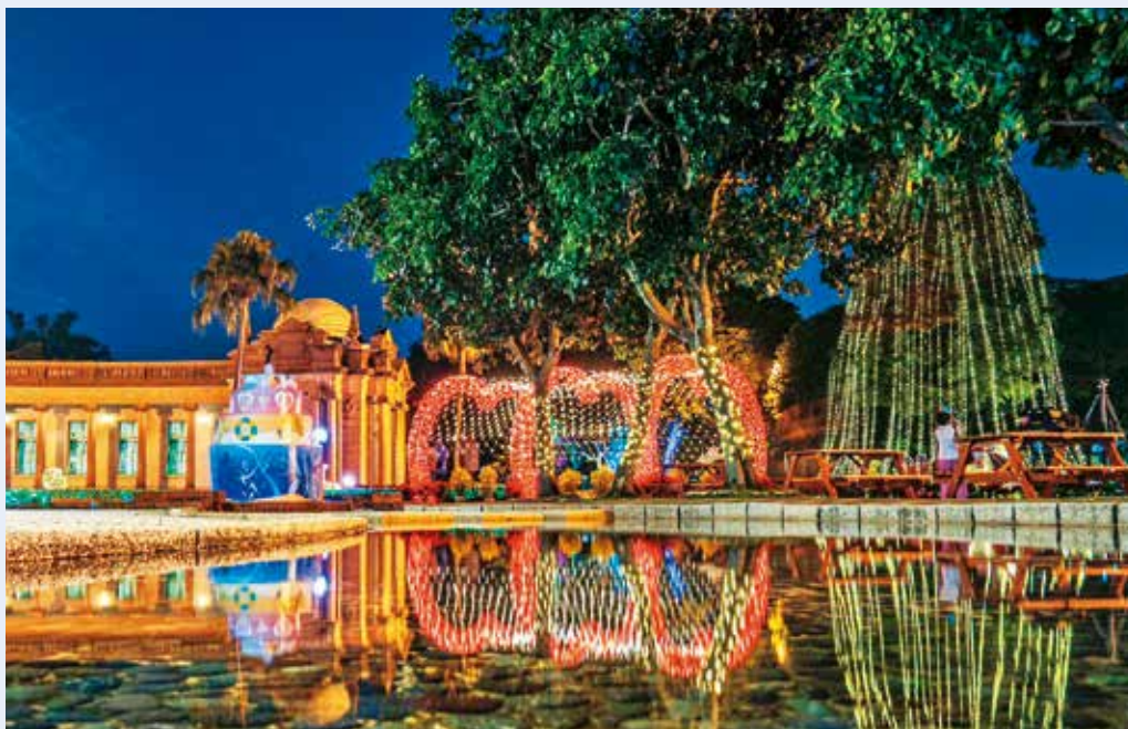
繽紛燈飾點綴台北自來水園區，營造出浪漫的耶誕氣氛。

PLAY樂購町」以「色彩」為主題，運用許多大型耶誕裝置妝點街頭。活動期間每週還有不同的展演活動，同時也串聯 80 家在地店家共同推出行銷優惠，涵蓋美食餐飲、百貨購物、潮流服飾、休閒旅宿、美容造型、影音娛樂等，讓民眾在西門町感受耶誕節慶的歡樂氣息，同時體驗商圈的多元風貌。