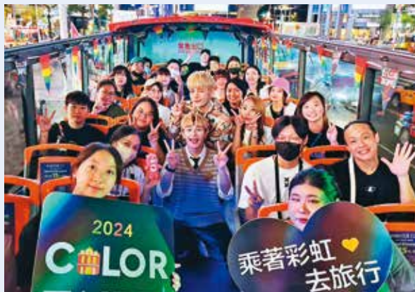
音樂團體VERA成員擔任「彩虹觀光巴士Tour」電影之旅導覽員，帶領民眾同遊西門町的電影拍攝場景。

為了讓多元性別議題走入社會大眾視野，台北市政府自2000年起每年補助辦理各類同志公民活動，透過展覽、彩虹路跑、論壇等形式，讓民眾有機會認識與理解LGBT+文化與生活。此外，台北市也設置了象徵多元包容的彩虹地景，並於