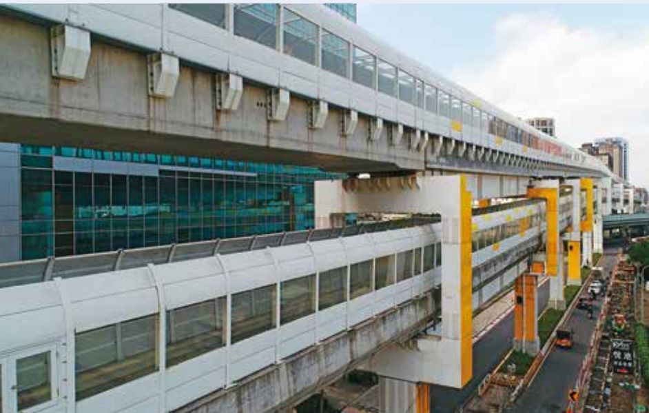
首都環狀線中原站將高架系統設計成疊式線形，以穿越狹窄的路幅。

此將高架系統設計成台灣首見的疊式線形；南、北環段的工程，則面臨比中和路廊更狹窄的路幅，以及更為複雜的地下管線，因此施工難度大幅提升。