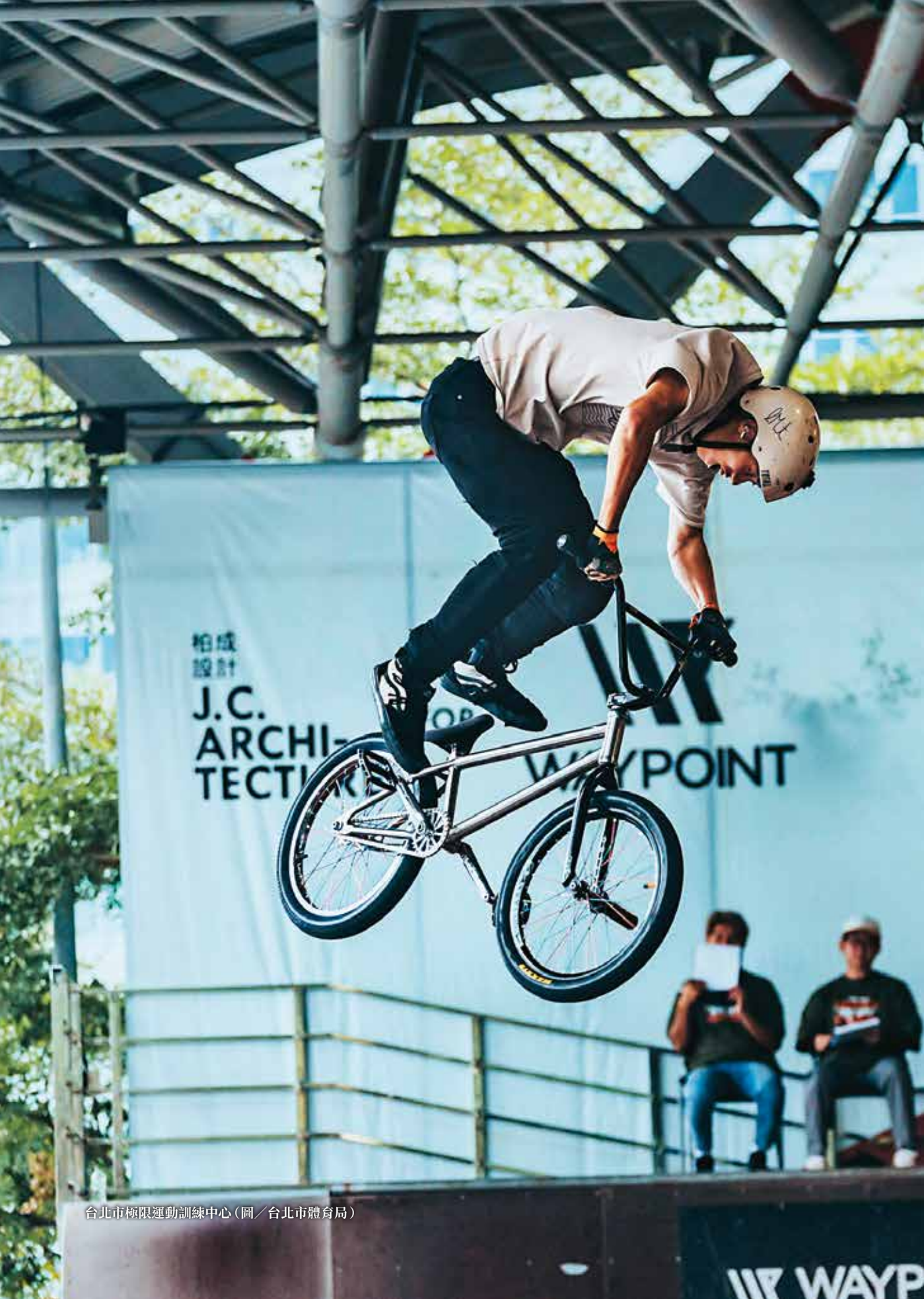
台北市極限運動訓練中心