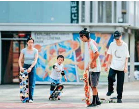
台北市電影主題公園舉辦滑板體驗活動，讓大人小孩共享滑板運動的樂趣。

藝青會自2009年進駐台北市電影主題公園後，也不定期邀請國外藝術家前來作畫，如今電影主題公園及周邊街區已成為塗鴉藝術的展示空間，一面面完整畫作綿延街頭，牆上的簽名、泡泡字、寫實、卡通及漫畫圖案鮮豔吸睛，吸引眾多旅客駐足欣賞。除了台北市電影主題公園，目前台北市在成美左、右岸、觀山、美堤、溪洲、景美、龍山及迎風等河濱公園有8處合法塗鴉區讓創作者發揮，也為台北的河岸帶來不一樣的風景。