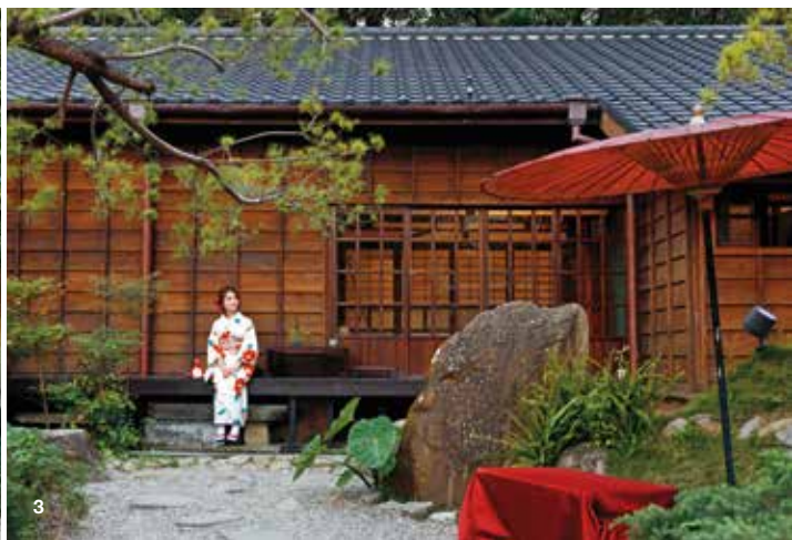
2.「徠卡之家」保留舊式房屋及門窗，與戶外植栽共譜老宅優雅風情。 3.日式建築群「榕錦時光生活園區」為市區中的生活休閒園地。