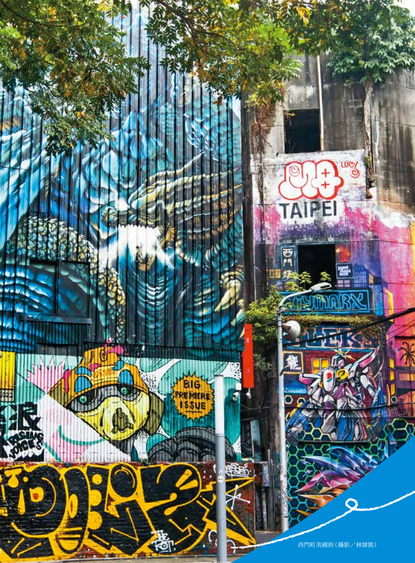
西門町美國街