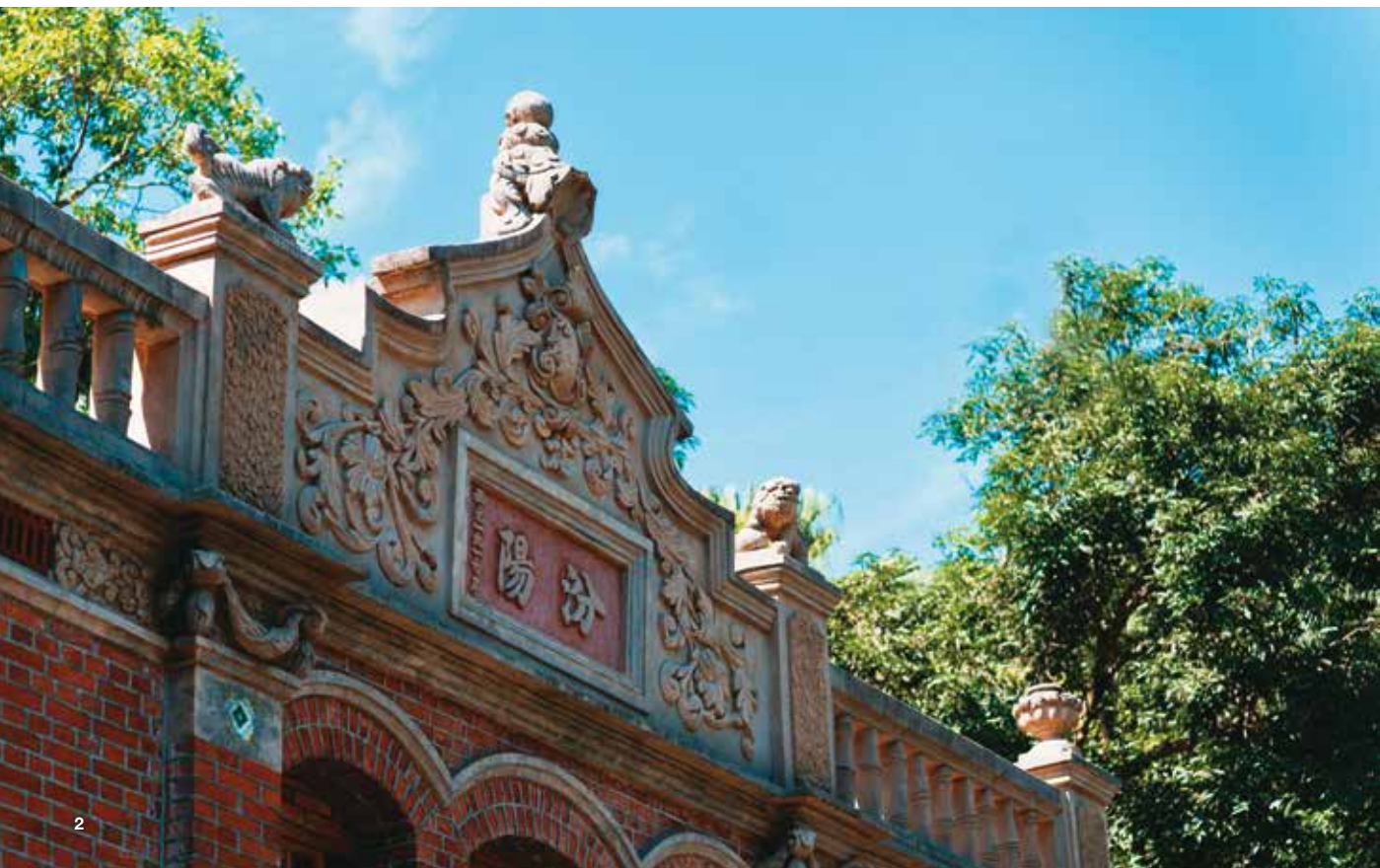
1. 北投「舊雙溪」(五分港溪)因河川生態復育有成，保有城市中難得一見的河道風光。 2. 內湖「郭氏古宅」為建於1920年代的閩南式洋樓，華麗的山牆以洗石子、泥塑及彩色瓷磚裝飾，並綴有精緻的造型。