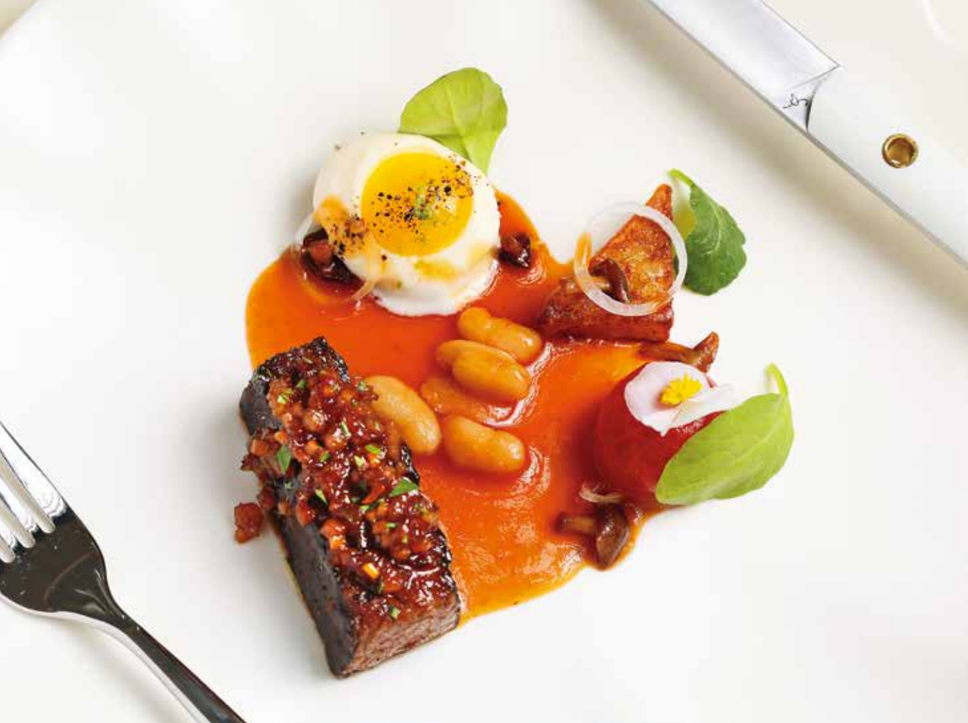
「Restaurant A」提供的精緻料理及擺盤呈現，蘊含主廚對細節的用心。