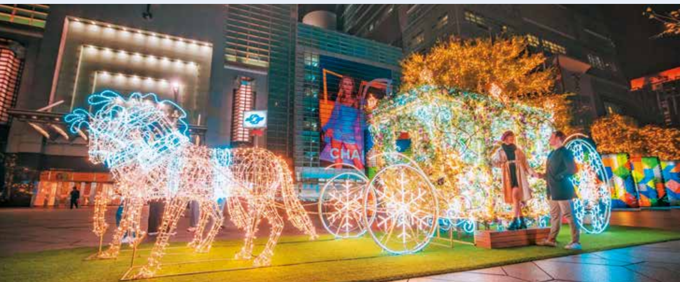
信義商圈的各式耶誕燈飾裝置閃耀冬夜。