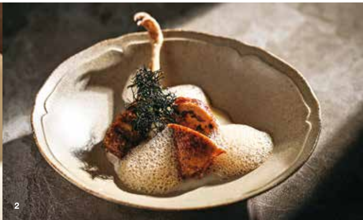
1.「NOBUO」的「南島羊里肌 百合根 血旺」以紐西蘭LUMINA羊鞍部位捲入綜合香草慕斯和羔羊胸腺後再煎烤，呈現層次豐富的滋味與口感。 2.「Wok by O'BOND」的「昏鴉」選用嘉義鶇鶇肉填入紅豆及牛肝菌等餡料，再以烤、炸方式處理不同部位，創造出風味獨特的料理。