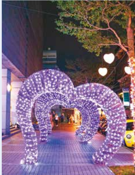
「台北耶誕愛無限」將布置五大主題耶誕燈飾歡慶佳節。

12月14日在大安森林公園也會舉辦耶誕音樂會，邀請歌手帶來民歌及流行歌曲表演，用美妙的樂聲為台北打造充滿喜悅與溫暖的耶誕時光，當天還有市集與踩街活動，適合全家大小一同前來。另外也結合周邊台大公館商圈、永康商圈及師大龍泉商圈店家推出商圈優惠活動，民眾可順遊周邊商圈，享受購物的樂趣。