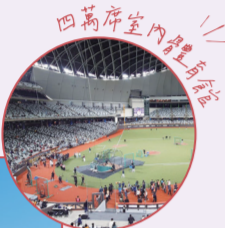
四萬席室內體育館

台灣首座可進行室內棒球賽事的體育館，適合舉辦各種體育賽事、音樂展演等活動，周邊還設有商場、餐飲等設施。