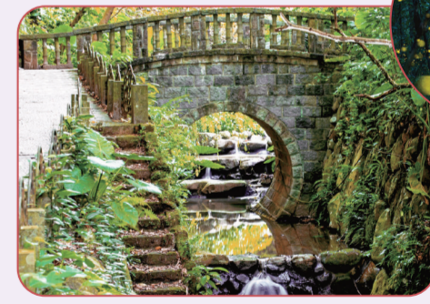
原來是螢火蟲的最佳季節

步道由塊狀砂岩與頁岩交疊而成，沿途除了可觀察溼地生態，還有親水平台可供戲水，山澗生態孕育有螢火蟲、小綠蛙和蕨類，生態豐富多元。