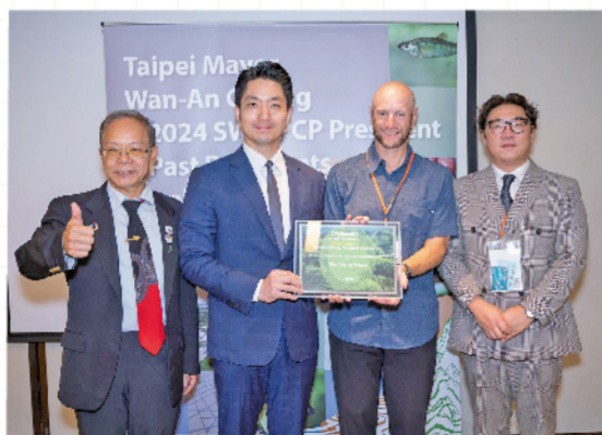
台北市獲「國際藍碳城市金獎」/ 台北市產業發展局

台北市長蔣萬安表示，台北市多年來積極推動濕地保護與藍碳計畫，期望為全球生態保育持續貢獻力量，台北市政府將持續深化藍碳保護策略，以具體行動打造宜居的零碳城市。