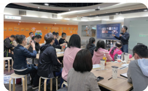
青年局辦理創業見習活動，知名咖啡品牌創業家現場分享經驗／台北市青年局