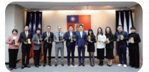
得獎業者與蔣萬安市長合影

台北市除積極輔導業者接軌國際永續認證，也舉辦如台北燈節等大型活動，與業者攜手共創觀光效益，共同打造台北成為世界永續旅遊目的地。