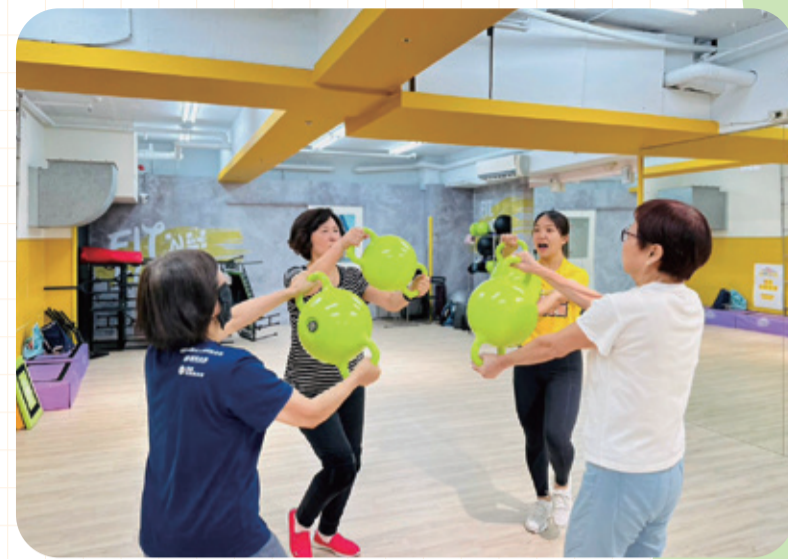
U-Sport臺北樂運動計畫深受市民喜愛