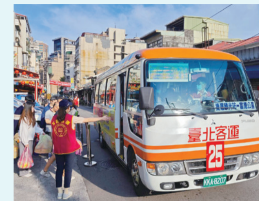
今年掃墓專車將提前啟動，歡迎民眾多加利用/台北市殯葬管理處