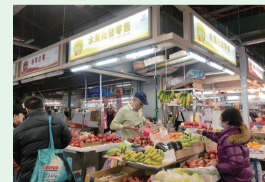
環南市場即日起試營運/台北市市場處

環南市場即日起試營運，歡迎市民前來感受新市場的舒適購物體驗，見證環南市場的華麗蛻變。