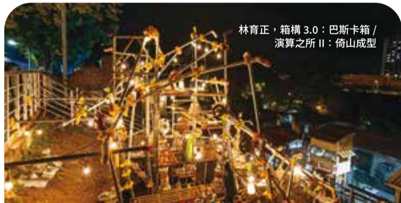
林育正, 箱構 3.0: 巴斯卡箱 / 演算之所 II: 倚山成型