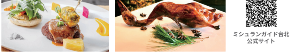
ヤマブシタケのステーキ / 陽明春天 子アヒルの炙り焼き / 頤宮

また「ピブグルマン」では数十軒の台北の B 級グルメを紹介しており、有名な臭豆腐、小籠包、ムスリムにも人気の牛肉麵、台北の人々が普段食べている涼麵、滷味、蚵仔煎、「黑白切」と呼ばれるおかずなどの庶民派グルメが並ぶ。台北の食文化を体験するなら、本場の台湾の味がぴったりだ。