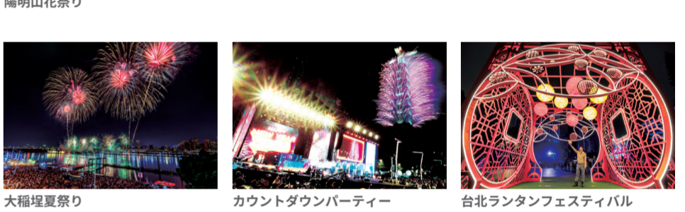
陽明山花祭り 大稻埕夏祭り カウントダウンパーティー 台北ランタンフェスティバル

台北マラソン、カラフル・クリスマス玩台北、公館クリスマスフェスティバル、カウントダウンパーティー、台北歳末大売出し、台北ランタンフェスティバルなどの冬のイベントは都市を活気づけ、年末年始の台北をカラフルに彩る。