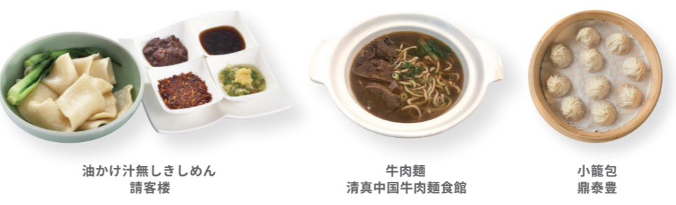
油かけ汁無しきしめん 請客樓 牛肉麵 清真中国牛肉麵食館 小籠包 鼎泰豐

台北には伝統的な料理や B 級グルメの種類が豊富にある。クリエイティブな新しい料理が簡単に見つかるだけでなく、ミシュランにも高く評価されている。2018 年に初の「ミシュランガイド台北」が発表されると、台北の多彩なグルメが世界に知られ、国内外のより多くの美食家が美食の都・台北を訪れるようになった。