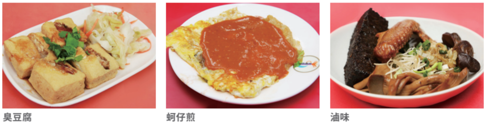
臭豆腐 蚵仔煎 滷味