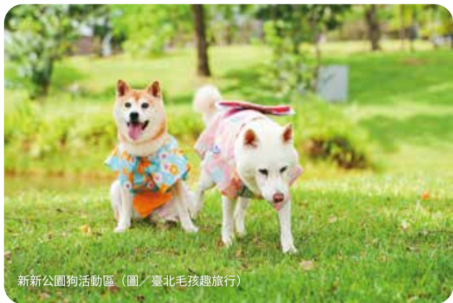
新新公園狗活動區

台北市積極打造寵物友善環境，提供毛孩安全活動、社交互動的戶外空間。近期南港區「新新公園狗活動區」正式啟用，佔地 300 平方公尺，是南港第 2 座、全市第 21 座狗狗專屬活動空間。新新公園狗活動區內保留自然草地與原生林蔭，並設有完善圍欄，兼具安全與舒適，民眾可搭乘 279 線或 711 線友善狗狗公車，帶著毛孩前來盡情跑跳。