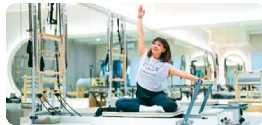
中正運動中心引進「器械皮拉提斯教室」。

另外也結合智慧科技導入「運動儲能設備」，民眾騎乘健身器材時可同步為手機、平板等充電，未來更將與「U-Sport 臺北樂運動」平台結合，累積電能兌換 U 幣，鼓勵市民將運動融入日常。全新亮相的中正運動中心，邀民眾一同體驗升級後的運動生活。