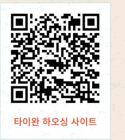
타이완 하오싱 사이트