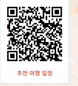
추천 여행 일정