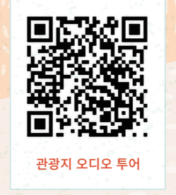
관광지 오디오 투어