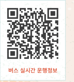
버스 실시간 운행정보