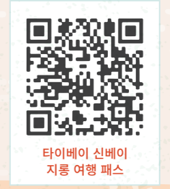
타이베이 신베이 지릉 여행 패스