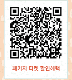
패키지 티켓 할인혜택