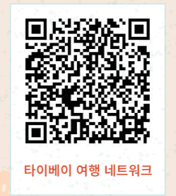
타이베이 여행 네트워크

근처 정류장: 양밍산 주차장(차오산서관) 타이베이시 베이더우구 후디로 89호 영업시간: 10:00-17:00(매주 월 휴무)