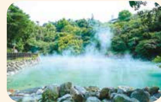
位於北投溫泉公園旁的地熱谷，吸引眾多國內外旅客前來探訪。

除北投溫泉外，台北市還有大稻埕、松山文創園區、貓空、台北 101 與西門町獲選「2026-2027 年台灣觀光 100 亮點」，歡迎國內外旅客蒞臨走訪，體驗台北的多元繽紛風貌。