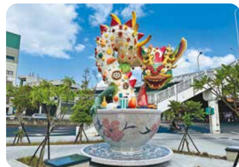
〈紫氣東來〉蜿蜒龍身綴以市場食材，呈現在地特色。

其中龍形雕塑〈紫氣東來〉高達 6 米，龍身運用剪黏與馬賽克技法，在荷蘭台夫特藍瓷上呈現生薑、牛肉麵、瓜果等食材，象徵豐饒與繁榮。北一門樓梯牆面上的〈環南風味〉以八組彩繪瓷盤，描繪從清晨進貨到餐桌上菜的飲食旅程，訴說庶民飲食與人情。二樓高牆上的陶板壁畫〈城市印象〉則結合艋舺龍山寺、西門紅樓、台北 101 等台北地標與全台灣農漁產地意象，凸顯環南市場作為食材集散地的重要角色。歡迎民眾走進環南市場，在熟悉的日常中感受新鮮創意，尋找屬於台北的色彩與風味。