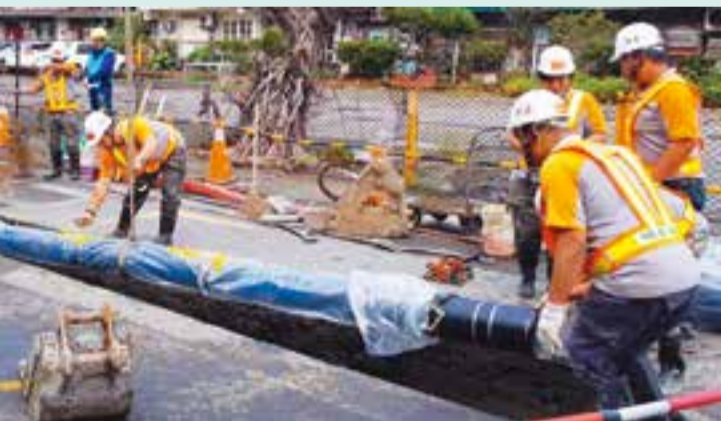
台北自來水事業處汰換老舊管線，守護市民用水福祉。

自來水管網攸關市民日常用水安全，為提升供水穩定與水資源利用效益，台北自來水事業處從管網改善、科技導入、跨域支援等面向，全面精進供水基礎建設，並於今年「2025 亞洲水獎」勇奪「水務公司卓越獎」與「年度跨境合作水務專案獎」兩項大獎。