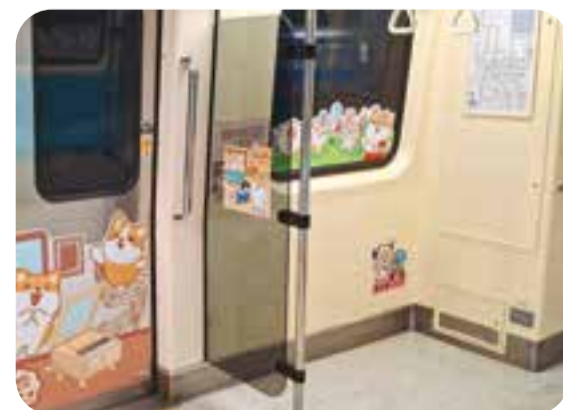
優化列車「親子友善區」嬰兒車停放空間以捷米貼紙輔助旅客識別。(圖/台北捷運公司)

包括第 2 至 5 節車廂移除中央立柱、部分車旁座椅與屏風，並增設車門處上方橫向扶桿及車側、座椅扶手，方便輪椅及嬰兒車旅客進出。同時調降車門周邊手拉環、改採鮮黃色吊帶，供不同身高乘客安全握取，第 3 節車廂第 4 車門至第 4 節車廂第 1 車門的「親子友善區」則各拆除一處 3 人座椅，嬰兒車停放空間更寬敞。未來將有更多優化列車投入尖峰時段疏運，帶給乘客更舒適的搭乘體驗。