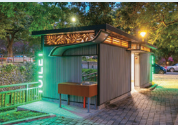
東河公園公廁導入燈號標示，提升辨識度與安全性。