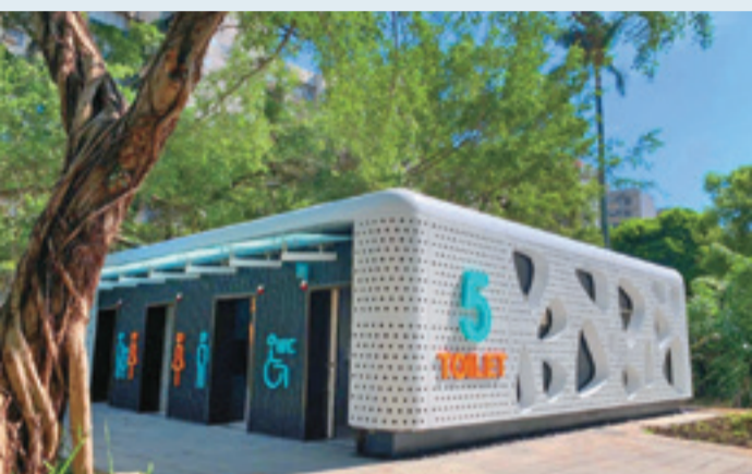
青年公園5號公廁外觀設計簡約現代，展現公廁新風貌。