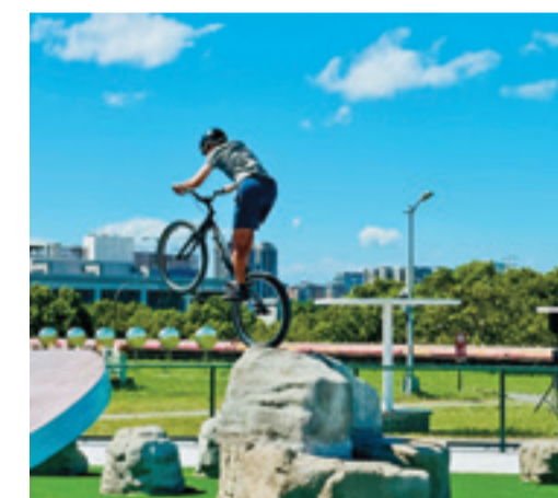
內湖休閒運動公園打造BMX極限單車運動的專業練習場地。

為打造更貼近極限玩家需求的場地，台北市工務局衛生下水道工程處舉辦多場工作坊，邀集玩家與教練參與規劃，特別新增「碗池區」、「拋台區」、「抱石區」與「新手區」四大主題場域，曲線更流暢、挑戰更多元，滑板、極限直排輪、BMX單車皆適用，初學者也能安心入門。極限運動場為免費開放，並提供夜間照明至晚間10時，讓民眾盡情享受極限運動的魅力。