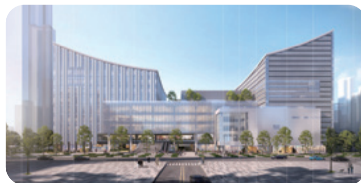
市圖新總館及台北音樂廳外觀意象以東方竹簡與西方五線譜為靈感。（模擬圖／台北市工務局水利工程處）

台北市立圖書館新總館、台北音樂廳兩館共構工程於今年 3 月正式啟動，以取得綠建築鑽石級、智慧建築兩大標章為目標，前者預計收藏逾 70 萬冊書籍、設置約 3,000 席閱覽座位及 2,000 平方公尺兒童圖書館，並導入智慧借還書與數位典藏系統，將成為全市規模最大的館藏中心。後者規劃約 1,500 席葡萄園式交響樂演奏廳，並配置排練、後台支援及樂團行政空間，以補足專業展演與常態排練所需。預計 2030 年竣工後，將成為台北最具指標性的藝文新地標。