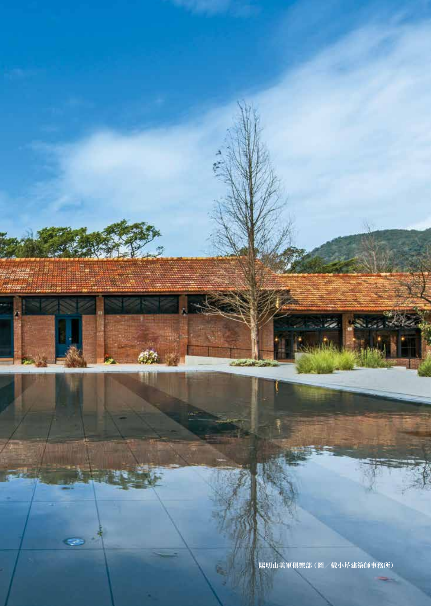
陽明山美軍俱樂部 (圖／戴小芹建築師事務所)