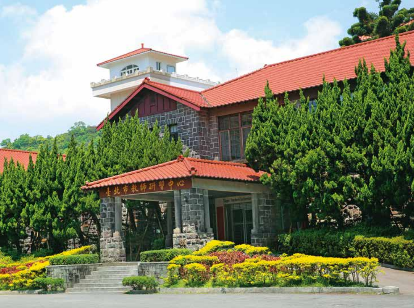
台北市教師研習中心的前身「草山眾樂園」是日本時代的公共浴場。

厚的神祕色彩，民間甚至流傳著「水鬼匿伏」或「抓交替」的傳說。隨著日本政府將溫泉文化引進這座山頭，現代化治理手段也隨之進駐。