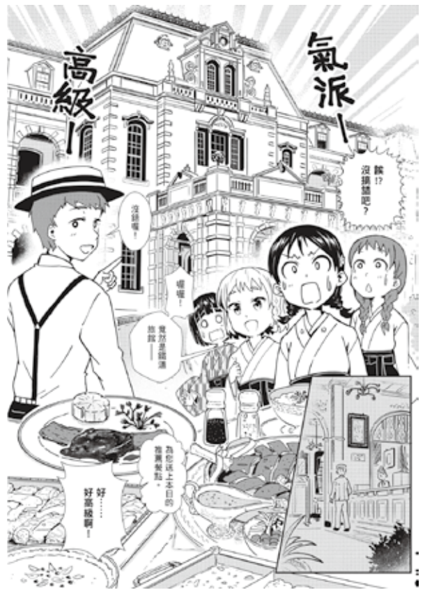
《友繪的小梅屋記事簿》以美食為引，帶領讀者穿梭在日本時代的台北城中區。（圖／清水、Haku、蓋亞文化）

告別大稻埕，腳步轉向日本時期被稱為「城內」的核心地帶。在漫畫《友繪的小梅屋記事簿》中，主角友繪是高級料亭「小梅屋」的接班人，平日在穿廊與廚房協助家務，並學習精緻的日本料理文化。作者清水與Haku表示，小梅屋的原型正是今日台北車站旁靜謐的木造古蹟「梅屋敷」（今國父史蹟紀念館）。為了籌辦學校園遊會的美食，友繪在充滿大正浪漫氛圍的