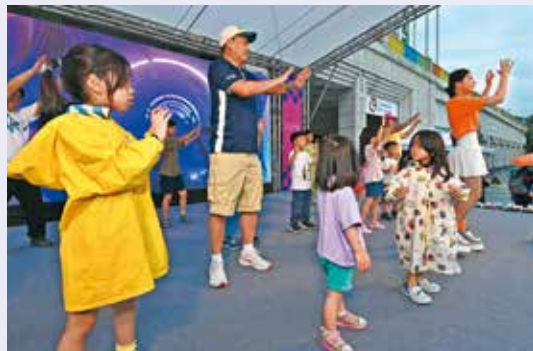
圖 · 文 · 張寅 · 台北市勞動局