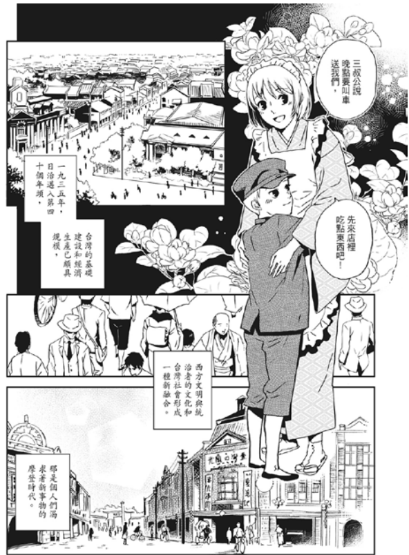
《北城百畫帖》在史料中融入奇幻敘事，呈現百年前台北城中區的榮景。(圖／AKRU、蓋亞文化)

張曉彤舉例，台灣因政權更迭造成歷史記憶斷裂，使人們回望日本時代的台北，往往有種異國的魔幻感，漫畫家 AKRU 即以魔幻元素建構這段遙遠的時空，並將史料鋪陳為細緻華美的圖像敘事，如《北城百畫帖》以1935年的台灣博覽會為線索，