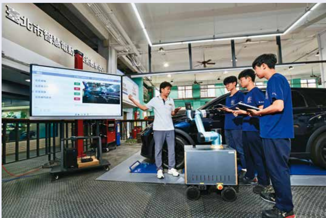
「智慧電動車技術教學中心」首創AI智慧手臂車檢平台，學生可學習車輛自動化檢測流程。

因應AI科技浪潮席捲全球，教育局透過系統化的策略，全面升級技術型高中的教學資源，為師生建構與產業接軌的學習場域。除以「新世代技職工場計畫」，三年投入2.7億升級現有實習工場，並相繼於南港高工、木柵高工分別設立「智慧電動車技術教學中心」與「無人機教育中心」兩大專業基地。前者首創以AI影像識別機器手臂執行車輛自動化檢測，後者則開設「無人機與AI辨識」寒暑假營隊課程，讓學生