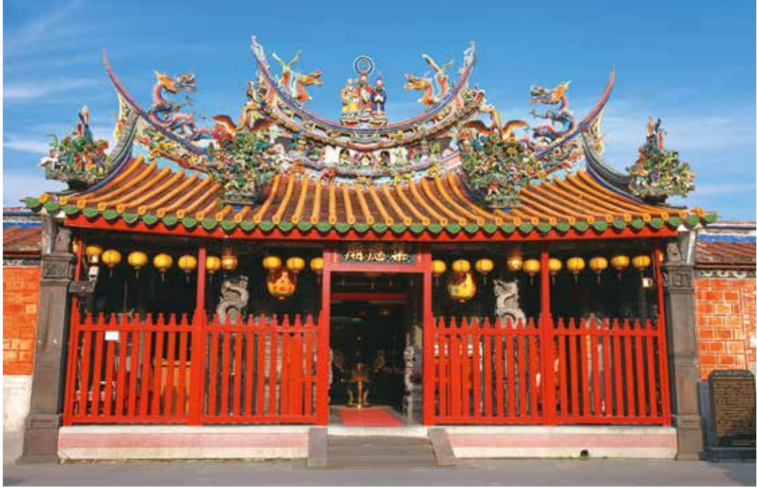
景美集應廟至今仍保留紅色木柵欄設計，成為跨越百年的象徵。

藝，值得細細品味。若欲深入了解集應廟的歷史與建築奧妙，可事先向廟方預約導覽，透過專人解說讀取其所承載的時代故事。