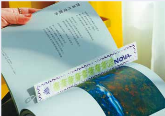
南港老爺行旅將退役布巾再製成書籤，成為環保又具質感的住宿紀念品。

除了制度管理與在地連結，旅宿業者對環境的承諾同樣需要以可量化的成效加以驗證。在「環境效益」面向，獎勵辦法明確要求業者提出能源使用、節水及廢棄物管理的實質減量數據，並將成果精算為可追