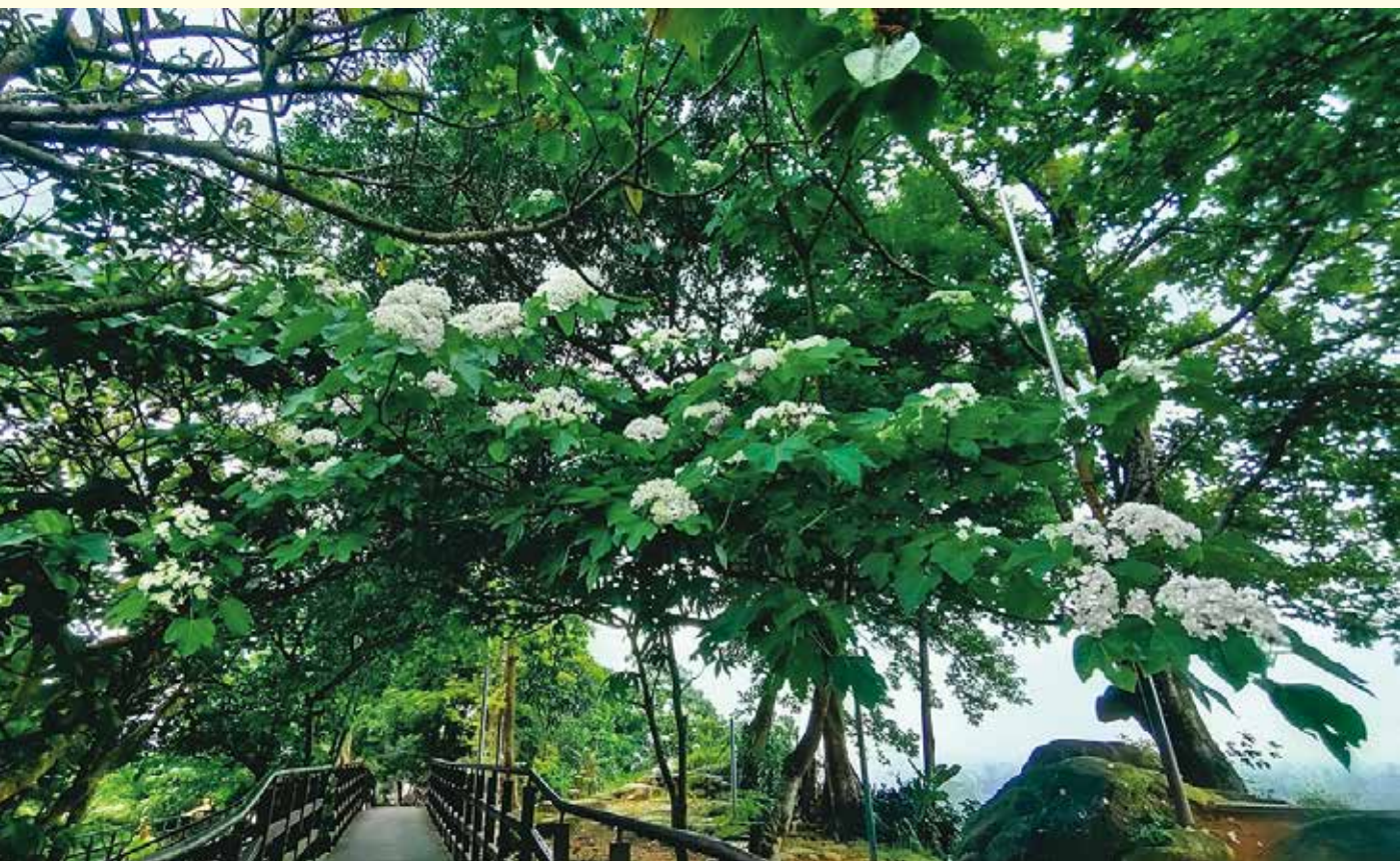
五月時仙跡岩步道可欣賞油桐花盛開的美景。

進一段故事。例如鄰近仙跡岩山坡的桐花林，每逢五月油桐花盛開，花朵隨風飄落鋪成一地花毯，宛如白雪輕覆山徑，恰與八仙之一何仙姑秀雅且冰雪靈慧的形象相互呼應，因而在此設立賞桐平台，搭配桐花造型的桌椅，旅人得以在花影間稍作歇息，感受山林的恬靜幽趣。