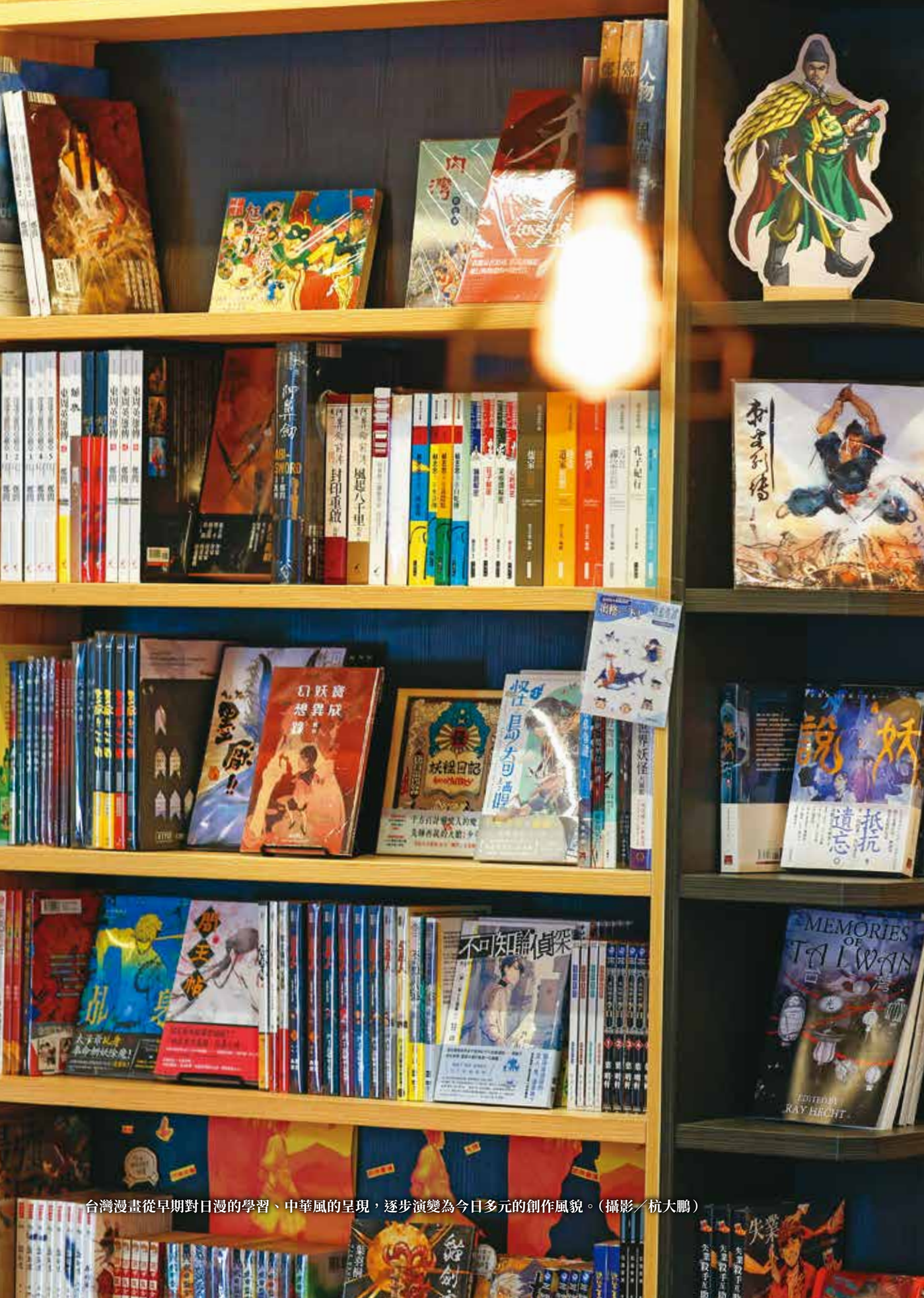
台灣漫畫從早期對日漫的學習、中華風的呈現，逐步演變為今日多元的創作風貌。