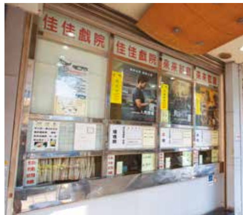
佳佳來來戲院充滿復古氛圍，電視劇《16個夏天》就曾在售票處取景。(攝影／賴智揚)

在大型連鎖影城與數位串流平台的雙重衝擊下，戲院仍長年維持親民票價，觀眾僅需以相對低廉的價格，便能享有一票看同影廳二至三部電影的實惠體驗，且延續傳統戲院的「不畫位」慣例，觀眾可自由入座，亦可攜帶外食入場，保留自在隨性的老派觀影模式。佳佳來來戲院以其獨特的營運節奏與