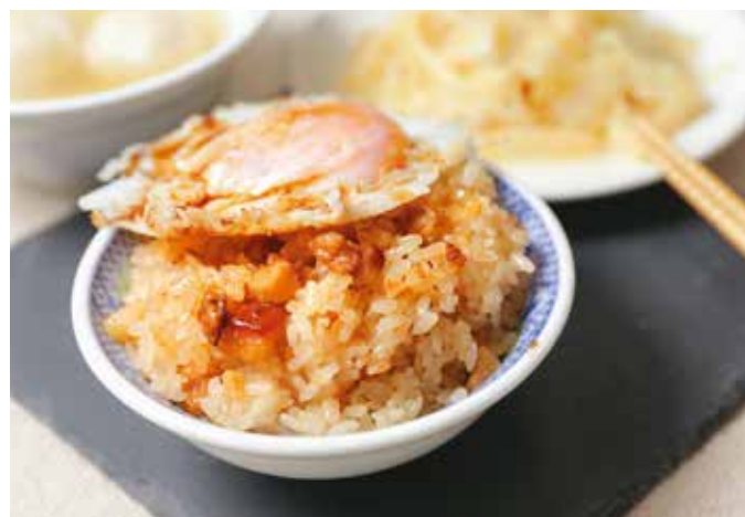
「珠記大橋頭油飯」以油飯搭配半熟荷包蛋，是最經典的吃法。