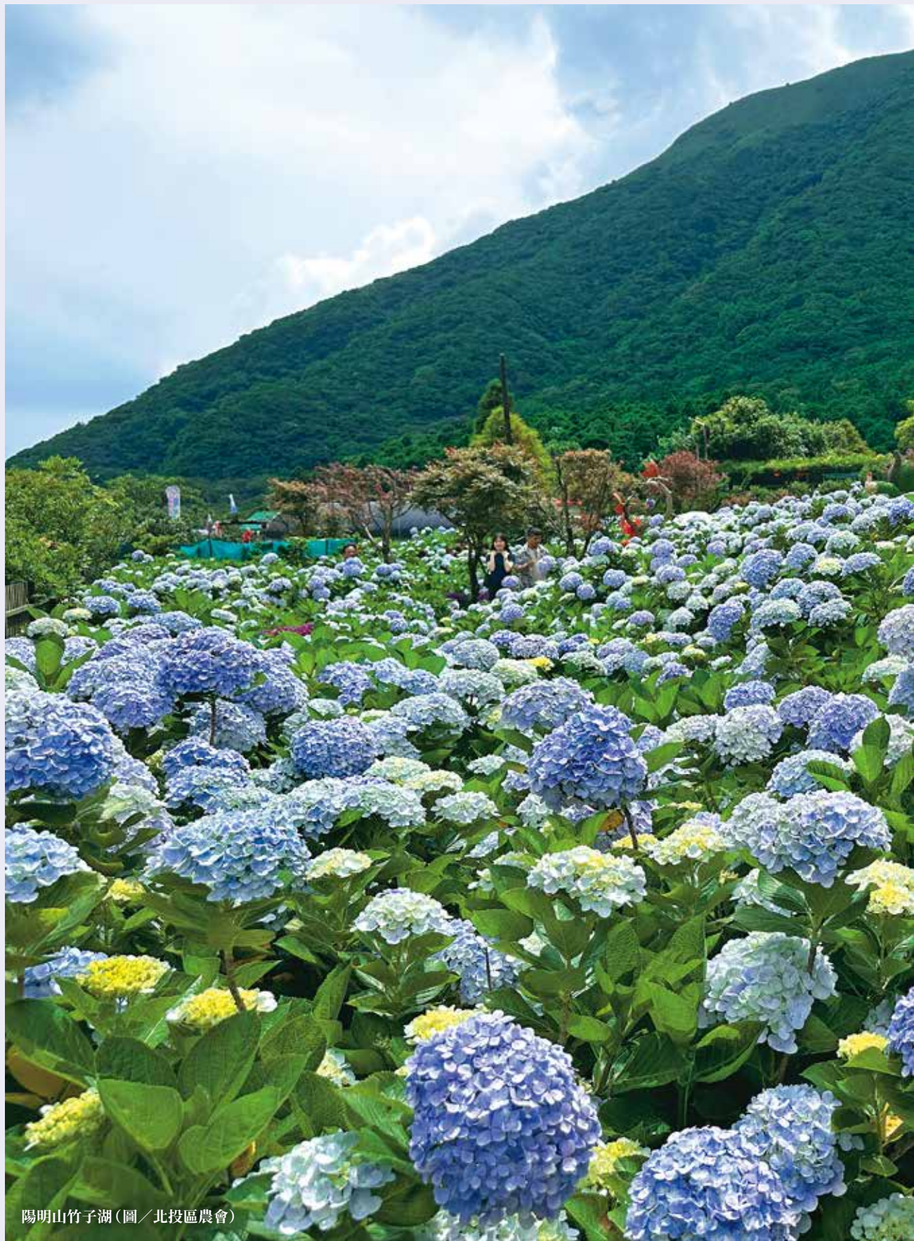
陽明山竹子湖