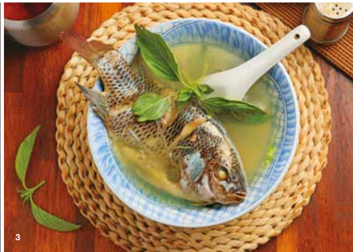
2.「Woolloomooloo」讓人在享用早午餐的同時，也能感受悠閒的氛圍。(攝影／洪子詠) 3.「以馬內利鮮魚湯」以清爽鮮甜的魚湯，為一天注入滿滿元氣。(攝影／彭仁義)

「樂子」等供應早午餐的美式餐廳，享用早餐成為感受悠閒的新選擇。隨後澳式餐廳「Woolloomooloo」也將澳洲的悠閒生活風格與早午餐文化帶入台北，點一份大早餐盤，能同時品嚐到肉、蛋、酪梨和天然酵母麵包等豐盛滋味，再搭配一杯澳式牛奶咖啡，坐在面迎窗景綠意、現代設計風格的用餐環境中，讓人不自覺放慢步調，悠閒享受早餐時光。