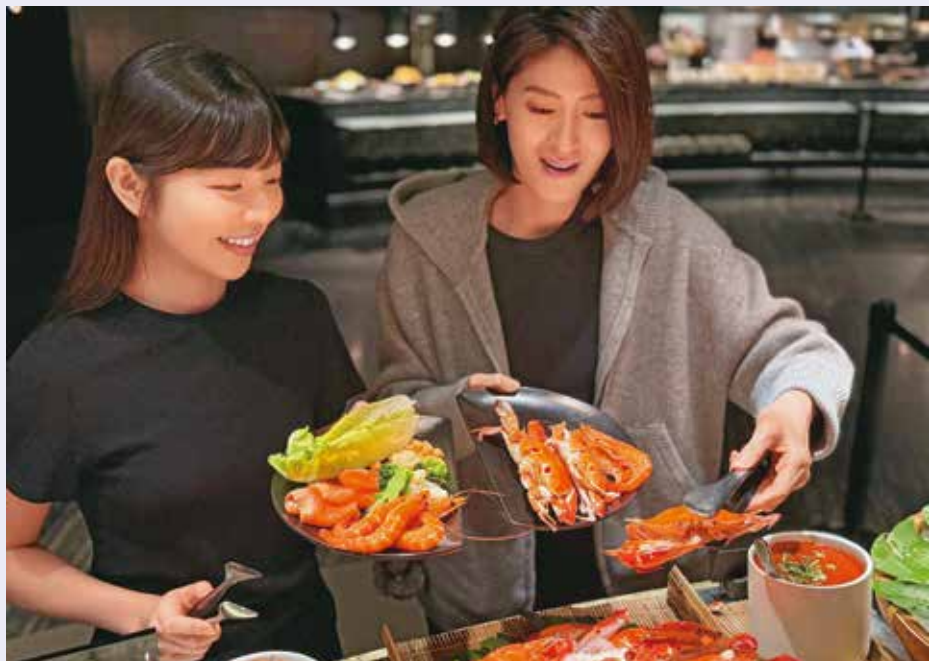
晶華酒店設計「月形取餐盤」，成功降低剩食。

文·張寅