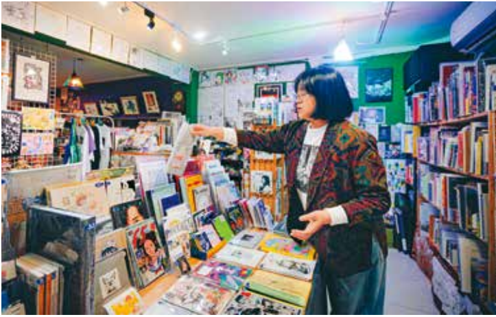
「Mangasick」匯聚異色藝術漫畫及另類經典，讓讀者從中發掘漫畫的多元面向。