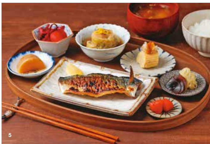
4.「蜂大咖啡」延續懷舊的日式喫茶店風格，供應簡單卻經典的早餐組合。 5.「朝炭」提供烤魚、白飯及醃漬物等日式朝食，讓人彷彿置身日本的晨間場景。