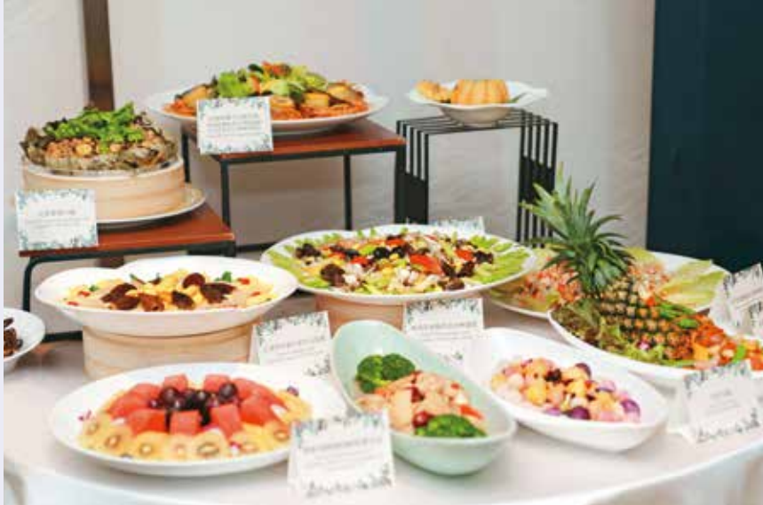
台北遠東香格里拉的「綠色婚禮」計畫，桌菜設計以低碳為核心。