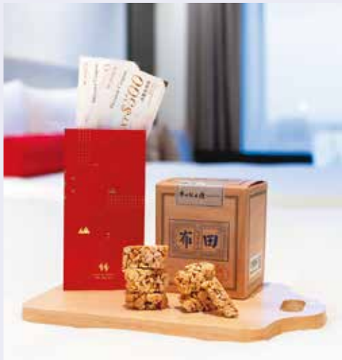
台北凱達大飯店與在地品牌合作推出春節伴手禮，與地方共生共榮。