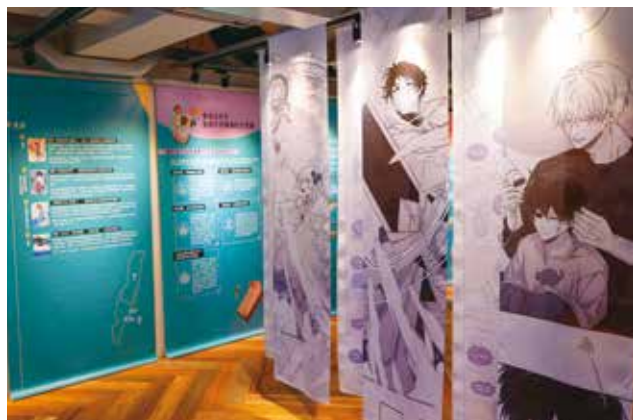
「臺灣漫畫基地」以展覽介紹台灣漫畫的發展歷程。

各式動漫場域串聯成台北獨特的風格路徑，不妨循著漫畫閱讀空間深入街區，展開一場在現實與想像間自由轉換的城市探索。■