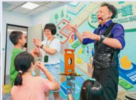
法商巴黎人壽與安達人壽藉由舉辦親子日活動，促進職場性別平等。