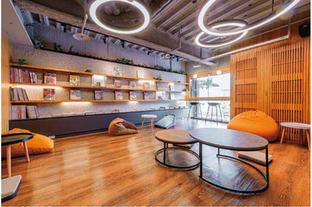
CBC SPACE 景美咖啡圖書館以溫潤木質調與柔和燈光交織出舒適的閱讀空間。(圖/CBC SPACE 景美咖啡圖書館)

設計獎的團隊操刀，以溫潤木質調與大地色系為主軸，營造沉靜氛圍。一樓為挑高設計的咖啡廳與接待空間，寬闊明亮，二樓則打造成靜謐自在的閱讀空間，並與東區的「boven 雜誌圖書館」跨界合作，收藏來自日本、歐美與世界各地的雜誌，內容涵蓋建築、設計、時尚與生活風格，讓訪客有豐富的閱讀選擇。